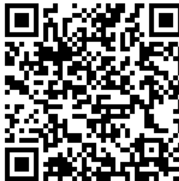
参加申込用 Google フォームの QR コード

【申込方法】 参加の申込は上記 Google フォームからお願いします。不明な点がございましたら、下記連絡先の電子メールまたはFAX でお願ひ致します。申込まいただいた方には、受領のメールをお送りいたします。返事が来ない場合は、お問い合わせください。申込に際しては以下のことをお教ひください（頂いた個人情報は学科広報活動以外には使用いたしません）。