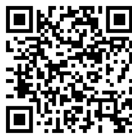
化学物理工学科ホームページ QRコード

開催情報は化学物理工学科ホームページ( http://tuat-chemphys.net/ )にも掲載しています。 緊急事態宣言発令に伴い、9月5日(日)に延期して開催します。 新型コロナウイルスの感染状況によっては中止、もしくは、プログラムの一部を変更する可能性があります。ホームページ等でお知らせします。